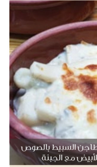
طاجن السبب بالصوص الأبيض مع الجبنة

شوي السمك في الفرن طريقة صحية تمنع خسارة فائدة الأوميغا 3 مقارنة بالقلي في الزيت!