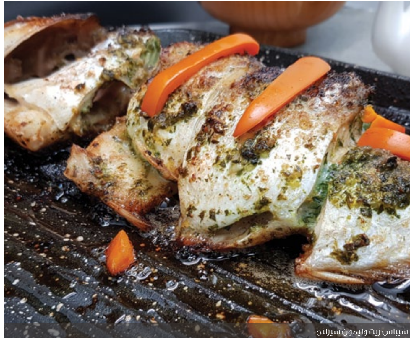
سيباس زيت وليمون سيزلنج