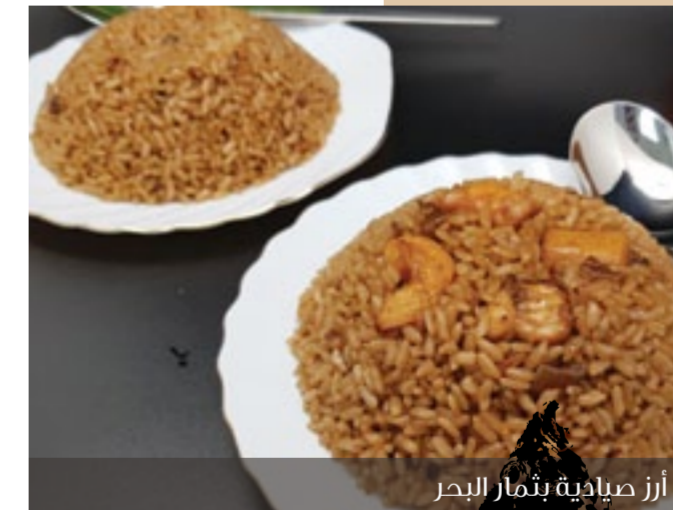
أرز صيادية بثمار البحر