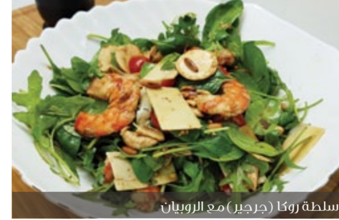
سلطة روكا (جرجير) مع الروبيان