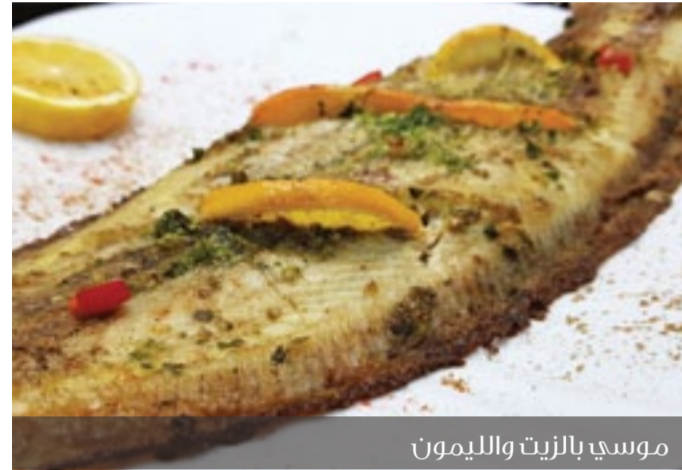
موسي بالزيت والليمون