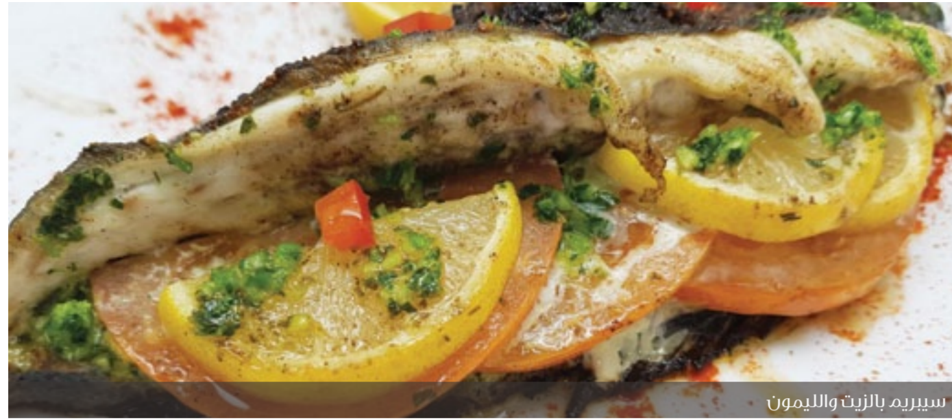
سيبريم بالزيت والليمون