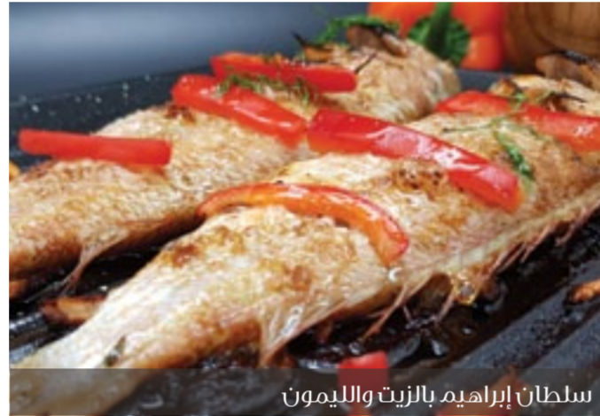
سلطان إبراهيم بالزيت والليمون