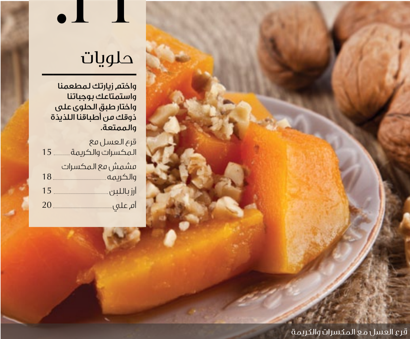
قرع العسل مع المكسرات والكريمة