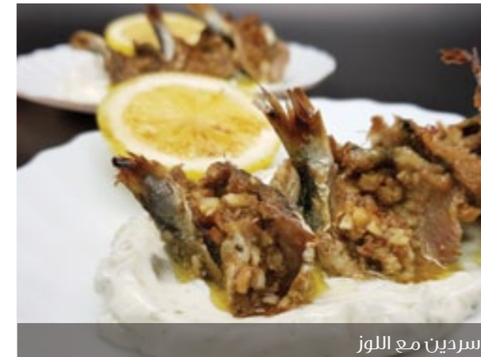
سردين مع اللوز