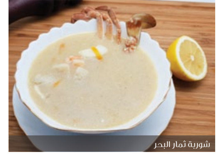
شوربة ثمار البحر

المعروف عن الطعام الصحي إنه للطعام الغير مطبوخ أو الطعام الخالي من النكهات!! دا غير صحيح، الطبخ حرفة وصنعة ليها أسرارها تخلينا نتبل الأكل من غير ما يفقد فوائده الغذائية! عارفين ليه؟ عشان سردينا مطعم مش عادي! السمك اللي أنت تعرفه بيصهي بطرق جديدة جداً، وقائمة التتبيلات طويلة، وبتبدأ بالأعشاب والبهارات وزيت الزيتون اللي بيزين أفضل وأند أكلاط مطعمنا.