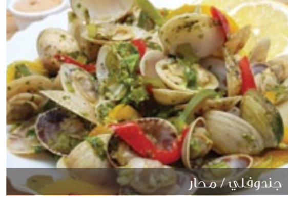
جندوفلي / محار