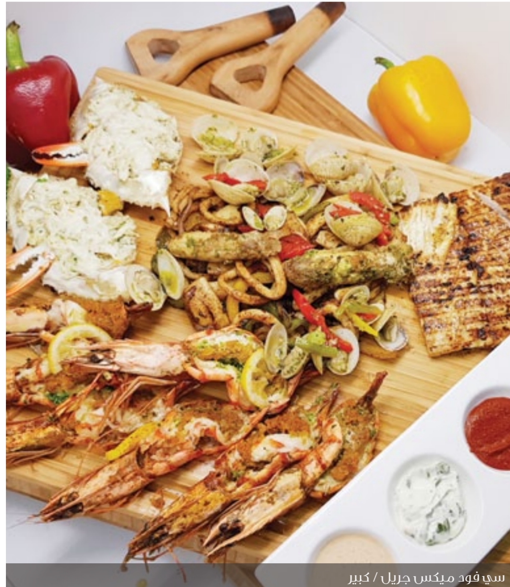
سي فود ميكس جريل / كبير

السمك اللي بيتم صيده محلياً بيكون مضمون أكثر، وكمان بيكون فريش أكثر.