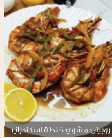
روبيان مشوي خلطة اسكندراني